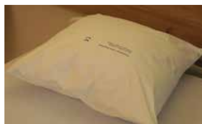
Oreiller anti-punaises de lit