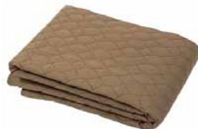
Couverture prévention suicide