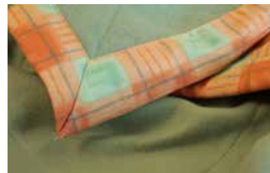
Finition coin capuchon