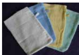
Gant de toilette éponge 100 % coton