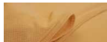
Finition drap demi housse nid d'abeille