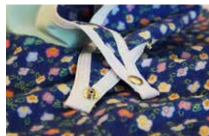
Bavoir imperméable en polycoton