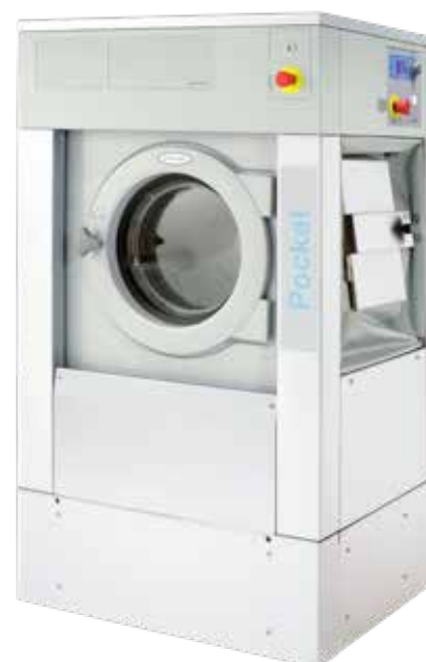
WB5180H sur socle

*concerne le modèle chauffage électrique.